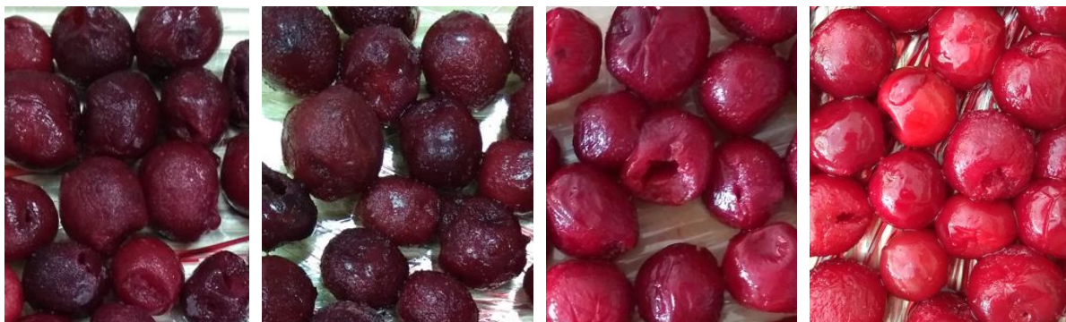
Fot. 1. Wygląd wiśni, przykłady

Analiza wyglądu zewnętrznego wiśni wskazała na prawdopodobną jednolitość odmianową owoców, zarówno w obrębie opakowania, jak i dostawców (fot.1).