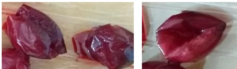
Fot. 2. Wiśnie uszkodzone mechanicznie

Owoce były czyste, wolne od zanieczyszczeń pochodzenia roślinnego i mineralnych oraz od śladów użycia środków ochrony roślin. W żadnej z próbek nie stwierdzono zanieczyszczeń obcych. Na wiśniach widoczne były ślady uszkodzeń mechanicznych i deformacji w wyniku procesu usuwania pestek (fot. 2). W próbkach pochodzących z obrotu hurtowego znajdowały się owoce popękane.